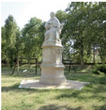
Statua di Paolo V

L'ultimo tratto di mura è quello che più ha perduto le caratteristiche originali. All'inizio è conveniente costeggiare il terrapieno stando sul marciapiede o sulla pista ciclabile che corrono sul lato opposto di Viale IV Novembre , salendovi poi una volta giunti all'altezza dell'incrocio con Corso Piave . In questa zona sorgeva una Fortezza (G) seicentesca a forma di stella, distrutta quasi completamente nei primi tempi dopo l'unione di Ferrara al Regno d'Italia. Nel prato sottostante il terrapieno sorge la statua sedente di papa Paolo V , che si trovava in origine al centro della Fortezza.