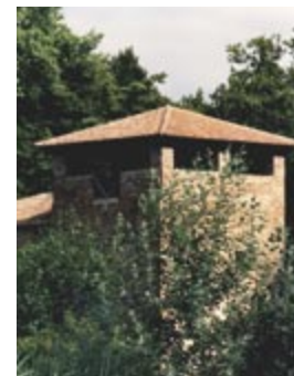
Porta degli Angeli

Questo tratto delle mura è il più verde e ombreggiato, e continua fino al Torrione del Barco (F) , una costruzione militare di grande interesse, in corrispondenza del quale le mura svoltano verso sud-ovest, correndo fino al punto di convergenza dei due assi maggiori di attraversamento della città moderna: Corso Porta Po e Viale Cavour.