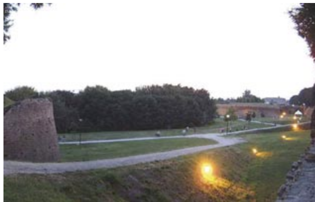
Le Mura, i baluardi del Cinquecento

Seguono il Baluardo di Santa Maria e il Baluardo di San Paolo , unici sopravvissuti dei cinque che circondavano lo scomparso impianto militare. Sul secondo si trova un cippo che ricorda gli eroi che qui persero la vita per l'unità d'Italia.