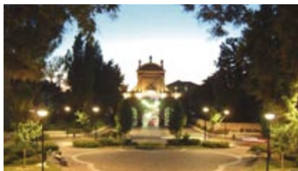
Punta della Giovecca

Continua la varietà di costruzioni difensive con il Baluardo di San Tommaso , triangolare senza orecchioni. Poco dopo si incontra il Doccile di San Tommaso , una sorta di canale artificiale in mattoni destinato a convogliare le acque delle fognature fuori della città, senza contaminare il fossato. Il tratto termina all'altezza della Punta della Giovecca (C) dove, verso l'interno, si possono ammirare il Piazzale Medaglie d'Oro , elegantemente disegnato, con lo sfondo dell'arco della Prospettiva , oltre il quale Corso Giovecca conduce in centro. L'itinerario prosegue nel sottomura costeggiando il Baluardo di San Rocco, distrutto nel sec. XIX, il cui contorno è ora disegnato da una serie di siepi. Superati il Doccile di San Rocco e la Punta di San Rocco , si raggiunge infine il Piazzale San Giovanni (D) , dominato da un Torrione difensivo rotondo e caratterizzato, al centro della rotonda, da una scultura di Giorgio de Chirico , che l'artista disegnò espressamente per Ferrara.