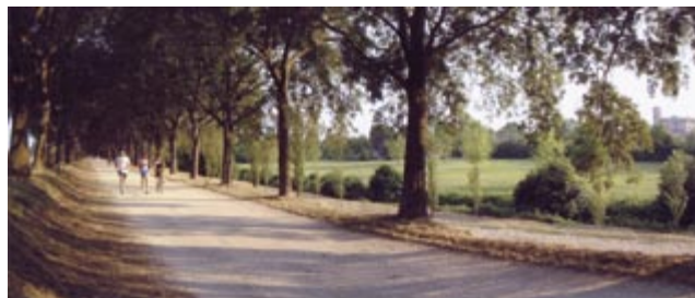
Le Mura degli Angeli

Progettate da Biagio Rossetti, le mura della città rinascimentale conservano in buona parte il disegno originale.