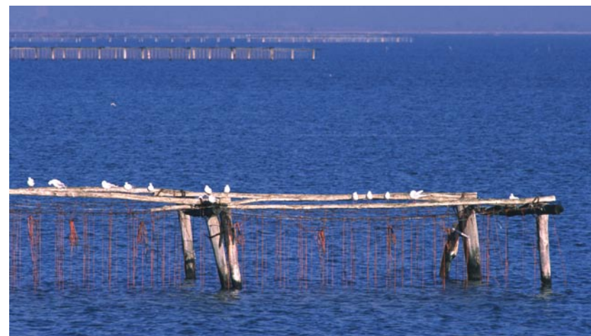
Sacca degli Scardovari

Albarella (fuori itinerario), dall'altro verso l'entroterra si trova Rosolina, in prossimità della quale si pedala alla volta di Porto Levante . Il Po di Levante, all'estremo nord del Delta, non è un ramo attivo, ma è mantenuto in vita da un canale artificiale.