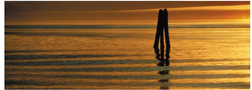
Laguna di Venezia