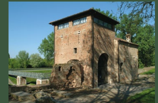
▲ Porta Paola (15) ◀ Porta degli Angeli (3)