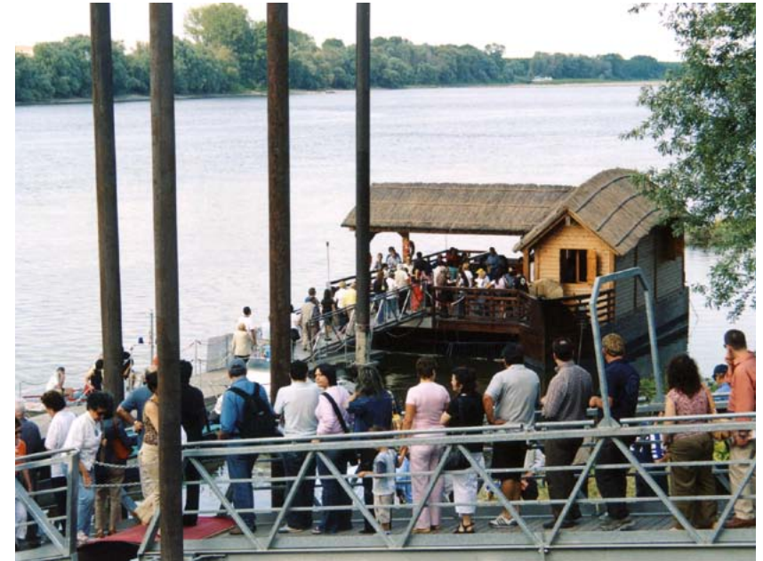
Ro, Mulino sul Po

Von Ro aus verläuft die Strecke durch kleine bewohnte Zentren mit Kirchen, Nebenstraßen und Wasserläufen, die unregelmäßige Landabschnitte zeichnen und die Landschaft der Großen Ferrareser Trockenlegung ankündigen. Die Tour beginnt auf dem Weg Destra Po auf dem Flussdamm und entwickelt sich bis zum Erreichen von Copparo und dem Damm des Po von Volano sowie anschließend der Oase der Lagunenschleifen von Ostellato .