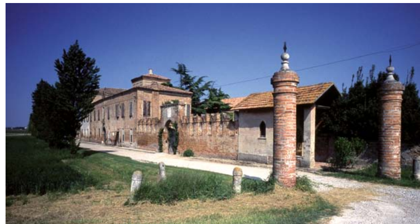
Sabbioncello San Vittore, Villa della Mensa