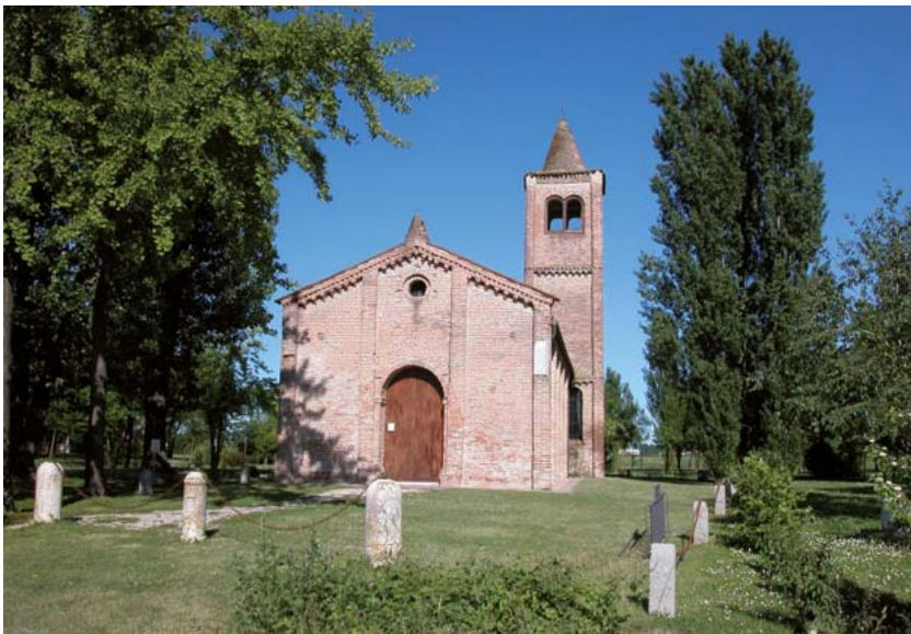
Pieve romanica di San Venanzio

Abfahrtspunkt der Tour ist das Außendeichland, in dem die Mühle am Po verankert ist. Es handelt sich um die getreue Reproduktion der vor mehr als hundert Jahren am Fluss vorhandenen Mühlen, die in einer außerordentlich eindrucksvollen natürlichen Umgebung aufgestellt wurde: die Mühle ist nicht nur ein Freilichtmuseum, sondern eine lebendige und produktive Realität, wo Mahlproben und der Vorbereitung von Brot in einem weiten touristischen Kontext mit Landeplatz und ausgerüstetem Außendeichlandbereich beigewohnt werden können. Im Namen und in der Erinnerung des Schriftstellers Riccardo Bacchelli geht es auf Nebenstraßen Richtung weiter Richtung Ro . Zuerst wird Zocca erreicht, wo es in die Abbiegung in die eigentliche Strecke auf der verkehrsberuhigten Straße geht (Radweg FE206), die schließlich nach Copparo führt. Vor dem Zentrum erwartet die verwunschene Kirche von San Venanzio den Touristen: Es handelt sich um eine der ältesten Sehenswürdigkeiten des Territoriums, Fresken aus der Bologneser Schule des vierzehnten Jahrhunderts finden sich hier. Das bewohnte Zentrum des im Mittelalter gegründeten Copparo entstand im Jagdrevier der Estenser, wie aus dem Aufbau des Palazzo Comunale, der auf den Ruinen einer Delizia